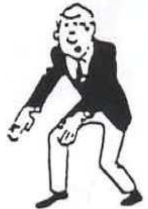
SONOMAMA ou YOSHI Suspension/reprise combat