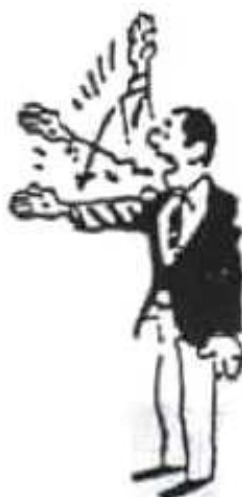
HIKI WAKE Match nul