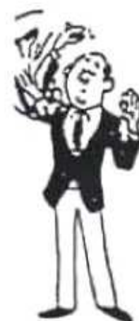
L'arbitre annule l'avantage qu'il vient de donner