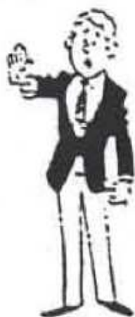
MATE Interruption du combat