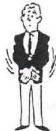
Réajustement du judogi face à l'arbitre