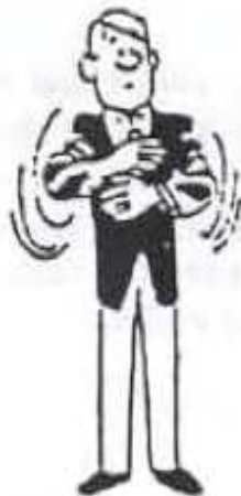
Pénalité pour non combativité