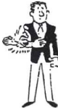
TOKETA Sortie d'immobilisation