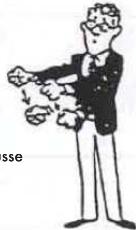
Pénalité pour fausse attaque