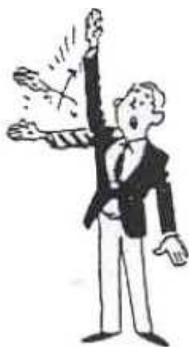
WAZA ARI AWASATE IPPON