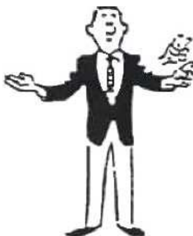
Enregistrement d'une intervention du médecin